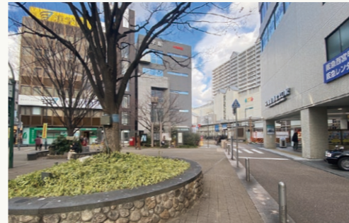
■阪急西宮北口駅周辺

市は令和6年12月、快適な市民生活の確保に関する条例(快適条例)に基づく喫煙禁止区域について阪急西宮北口駅周辺とJR甲子園口駅周辺の2区域を新たに指定する方針を発表しました。受動喫煙による健康被害などの苦情が多いため、喫煙禁止区域は既存区域の市役所周辺を含めて3区域になります。 市は平成20年6月、改正した快適条例を施行。喫煙禁止区域の指定によって違反者に対する5万円以下の過料の徴収(同条例施行規則で過料額を1000円と規定)をできるようにしました。翌21年4月に市役所周辺を指定しました。 市は公共の場所でのポイ捨て、歩行喫煙や自転車乗車中の喫煙をしないよう努力義務を定めた快適条例の周知のため、喫煙禁止区域以外の主要駅前でも歩行喫煙者に対する喫煙マナー向上の啓発活動などを実施してきました。コロナ禍が落ち着