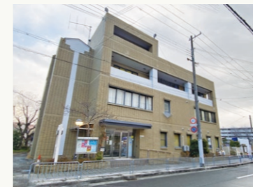
■市立南甲子園公民館=南甲子園