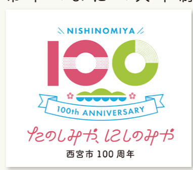
■市制施行100周年のロゴマークとキャッチフレーズ(西百無)第0185号

市は文教住宅都市として発展してきたまち「西宮」の歴史と現在、未来への展望をまとめ、西宮の「ええところ」や市内外で活躍する「みやっこ」にスポットを当てた記念誌を制作し、令和7年3月に発行する予定です。