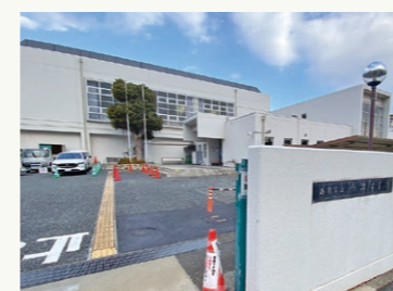
■市立今津体育館=今津真砂町

市は市議会12月定例会に公民館や地区市民館、運動施設をはじめとする公共施設の施設使用料を改定する関係条例案を提出し、承認されました。約5年ぶりの改定で、公民館や地区市民館で平均約20%の値上げになります。運動施設は平均約1%増とほとんど変わりません。