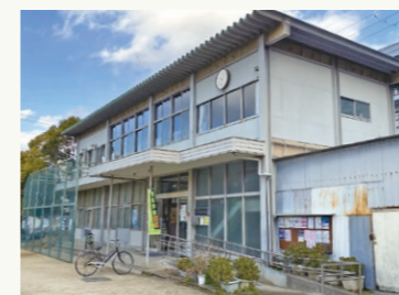
■市立網引市民館=甲子園網引町