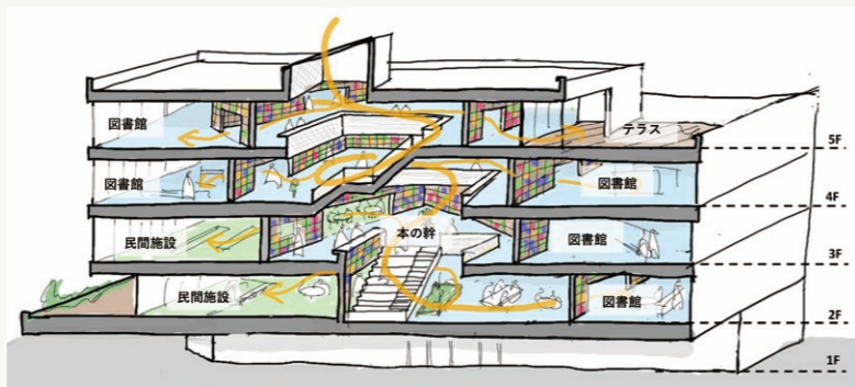
■新しい市立中央図書館の内部空間のイメージ図

市は令和6年12月、新しい市立中央図書館が入る図書館棟の構想を発表し、中央部分に地上2階から最上階の5階までの大きな吹抜けを設ける方針を明らかにしました。利用者が吹抜けに設置された階段を上り下りしながら、新しい本と出会える環境を整えるのが目的。