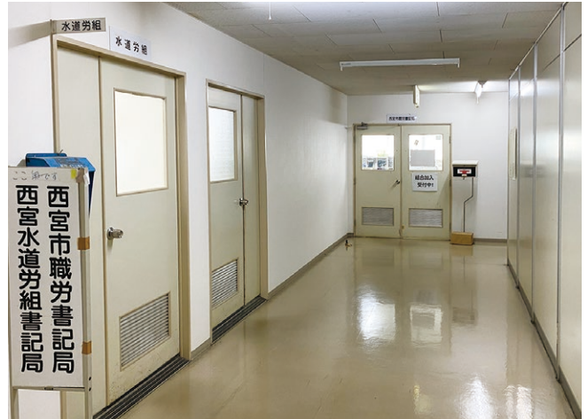
■職員会館3階フロア