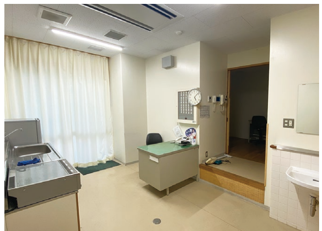
■市立香櫨園小学校の用務員室