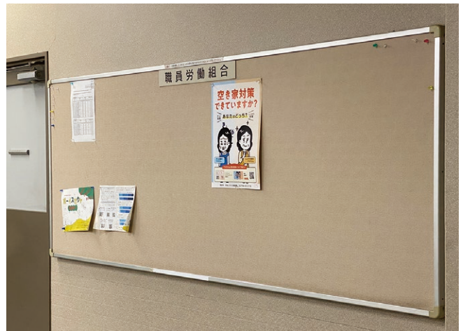
■市役所本庁舎内の掲示板