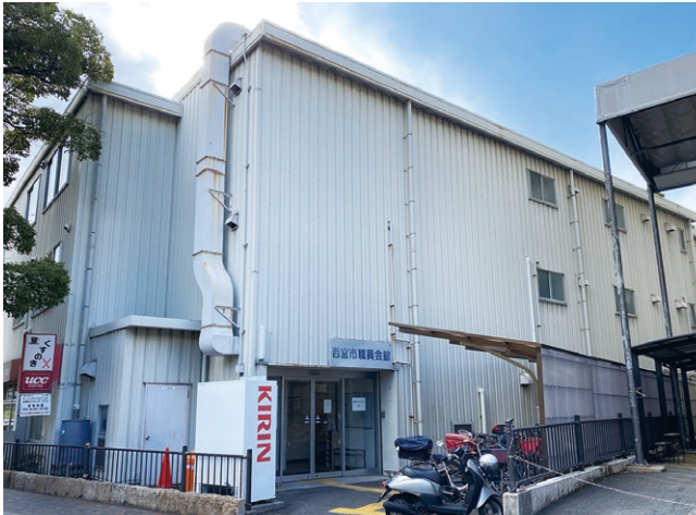
■西宮市職員会館＝六湛寺町