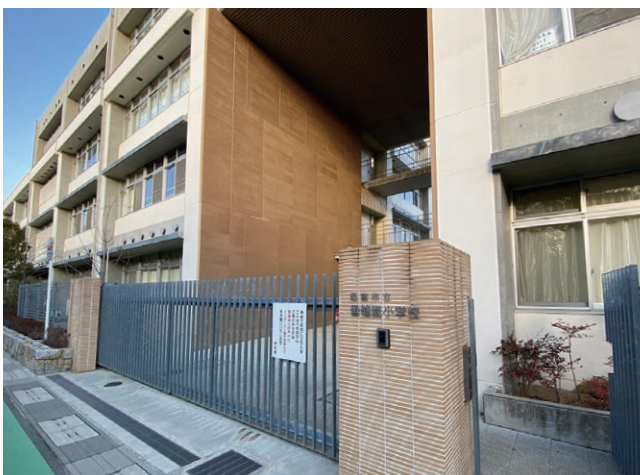
■市立香櫨園小学校＝中浜町